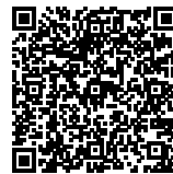
ICE TRISNAWATI Asesor Kompetensi